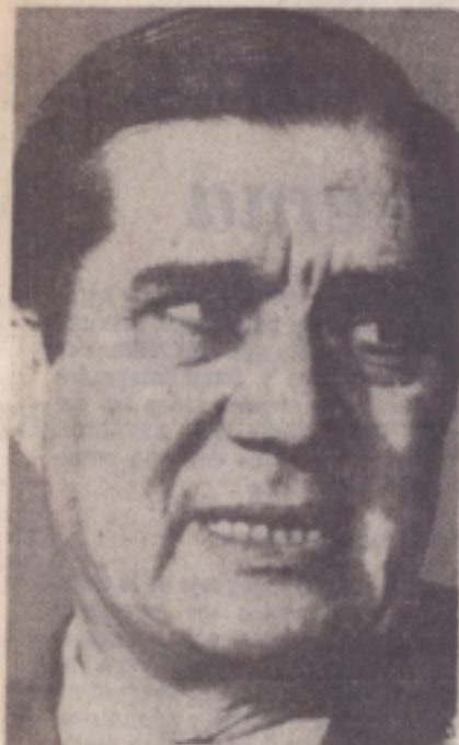
Basilio Lami Dozo

Como se recordará Lami Dozo, es el segundo ex integrante del gobierno militar que queda en libertad -primero lo fue el brigadier general Omar Grafigna, como informamos en nuestra edición anterior- no recupera su libertad, en definitiva, ya que se encuentra cumpliendo prisión preventiva rigurosa en la unidad de su arma antes indicada, dispuesta por el Consejo Supremo de las